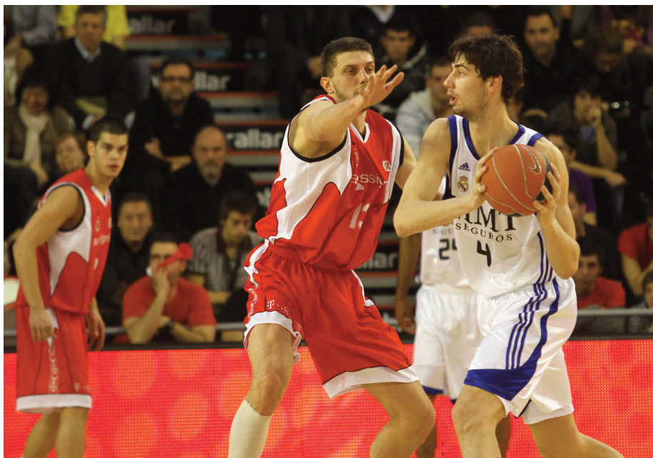
Ante Tomic, valor del Real Madrid

durante los 40 minutos. Parece que les cuesta mucho y, casi siempre, tienen un bajón de juego importante durante los partidos. Esto, en un torneo de la Copa del Rey, les puede condenar. Como puntos positivos destacar que son un equipo, donde no se juega para un jugador y que cualquiera puede aparecer en un momento dado para ser el protagonista del encuentro.