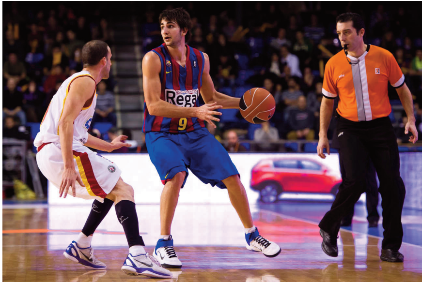
Regal Barcelona, uno de los favoritos.

Y es que, el plantel con el que acuden todos los equipos está plagado de estrellas. Y estrellas es lo que precisamente se ve en el Palacio de los Deportes durante los 4 días de la competición, tanto en la cancha como en las gradas ya que son