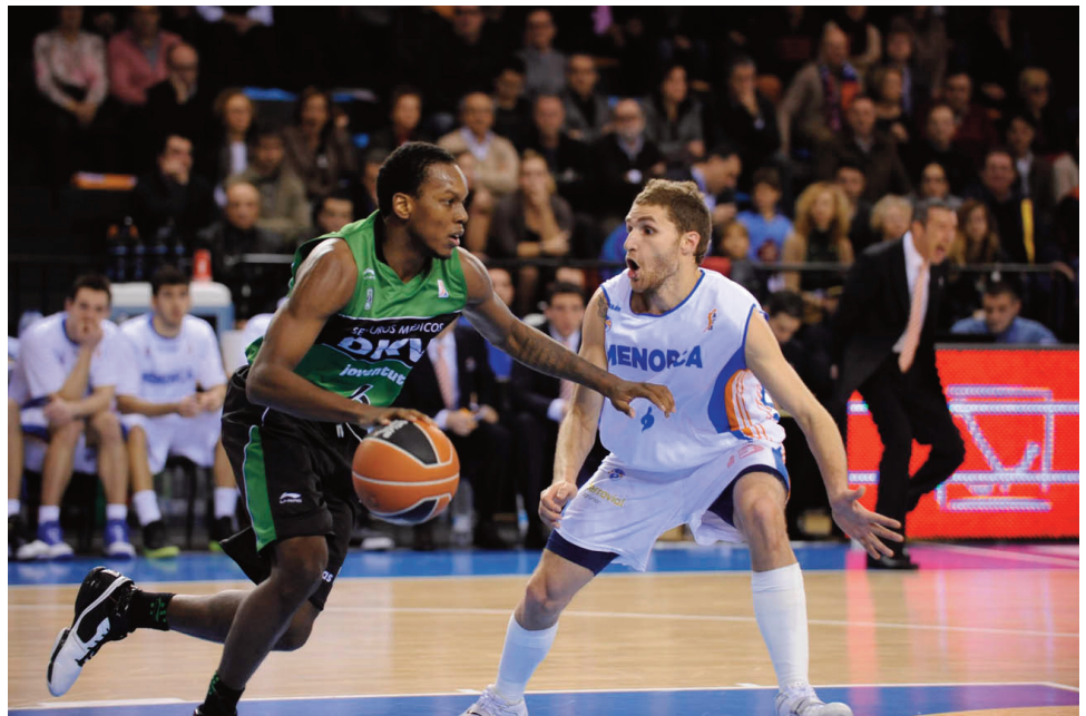
Ante el Menorca