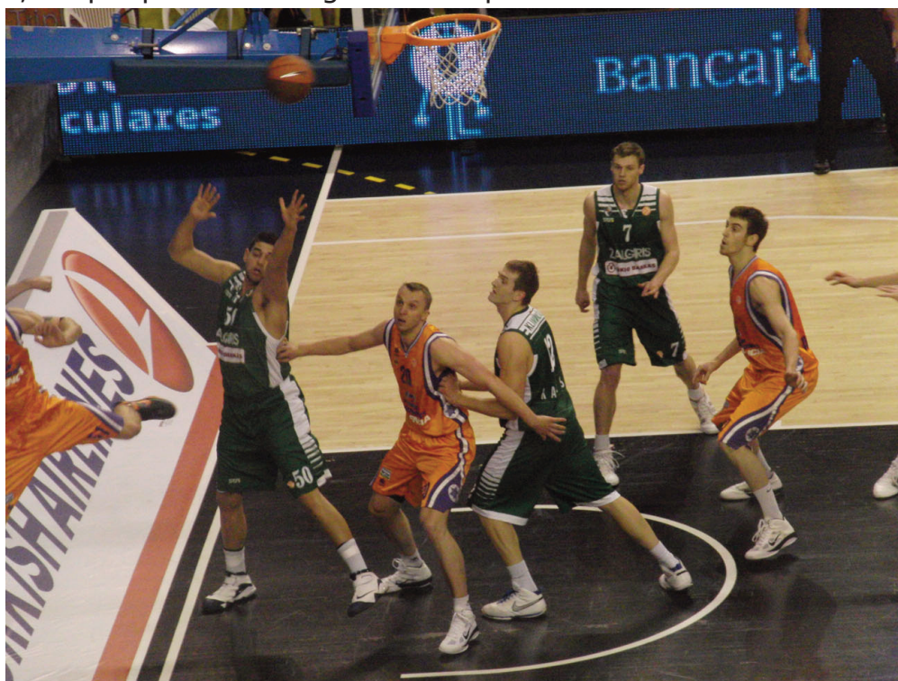
Power Electrónica disputa un balón al Zalgiris - Cristina Ruipérez

objetiva, es cierto todo lo anterior de calendario, rivales y fechas, pero también es completamente cierto de que todos han jugado contra todos, por lo que entra en juego el factor de la confianza, puede que hayan existido equipos que confiaban en que se les iban a producir determinados resultados y al fallarles se han visto con el agua al cuello , es decir, cada equipo ha cometido sus aciertos y errores, y solo ellos son responsables de sus situaciones.