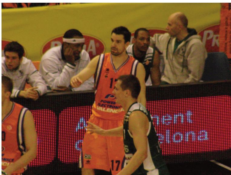
Power Electronics Valencia, equipo en alza

Pero este gran inicio solo fue un espejismo y un nefasto inicio de temporada con 1-6 en liga ACB y 1-3 en la Euroliga hizo que el club valenciano