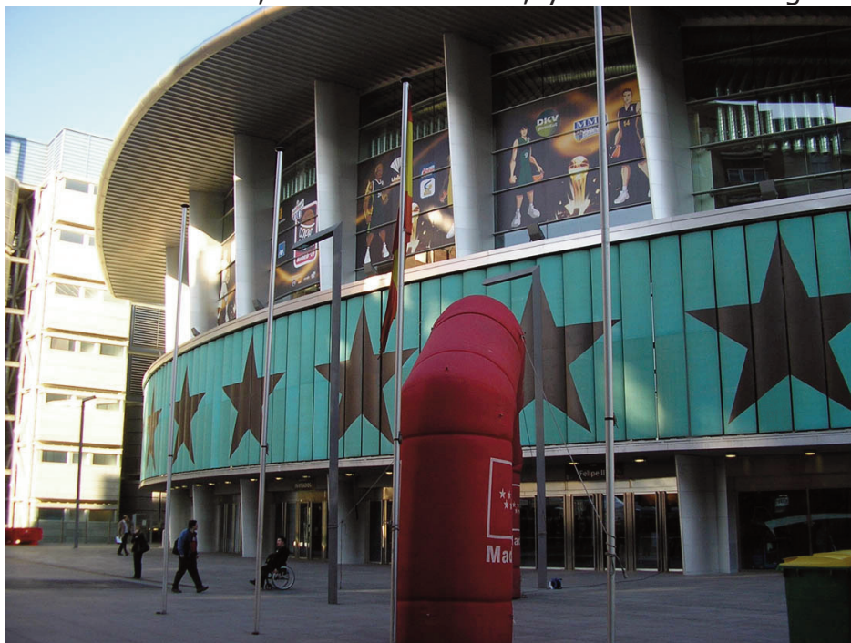
Palacio de Deportes de la CAM - Borja Barrete

Actualmente, la Comunidad de Madrid ha cedido el espacio para la disputa de encuentros ACB por parte de uno de sus anteriores moradores, Asefa Estudiantes, que firmó un convenio durante 10 años, y además de organizar