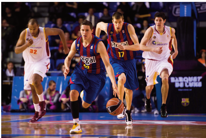
Son los claros favoritos

Los fichajes de Ingles y Anderson han tenido resultados dispares, el australiano ha notado mucho la salida de Granada para recalar en un equipo de tanta magnitud, teniendo un rendimiento un tanto discreto. Mientras que