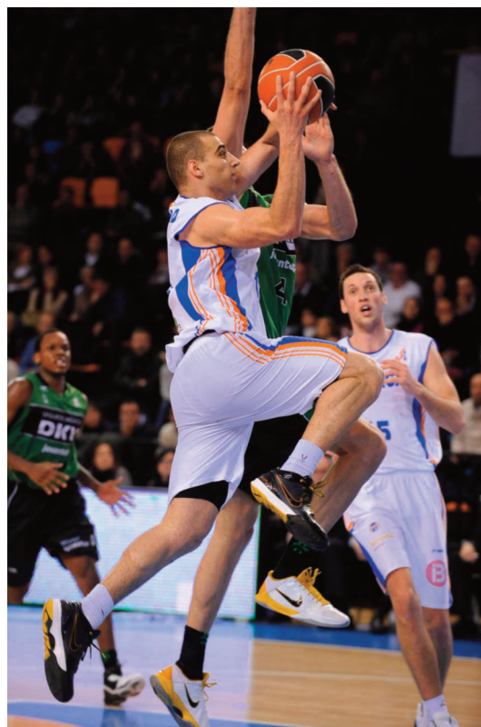
Ante el Menorca

De lograr pasar, sería una de las noticias de esta Copa del Rey, uno de los factores que tienen a su favor, es que los grandes suelen sentir bastante presión el primer día de competición, y no realizan grandes partidos.