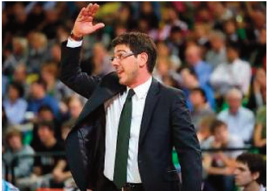
Fotis Katsikaris en un encuentro

Quizá, de todas las derrotas que acumularon en casa, la menos esperada fue la de Gran Canaria , un partido que a priori debería haberse vencido, pero que los canarios se llevaron en los últimos segundos del