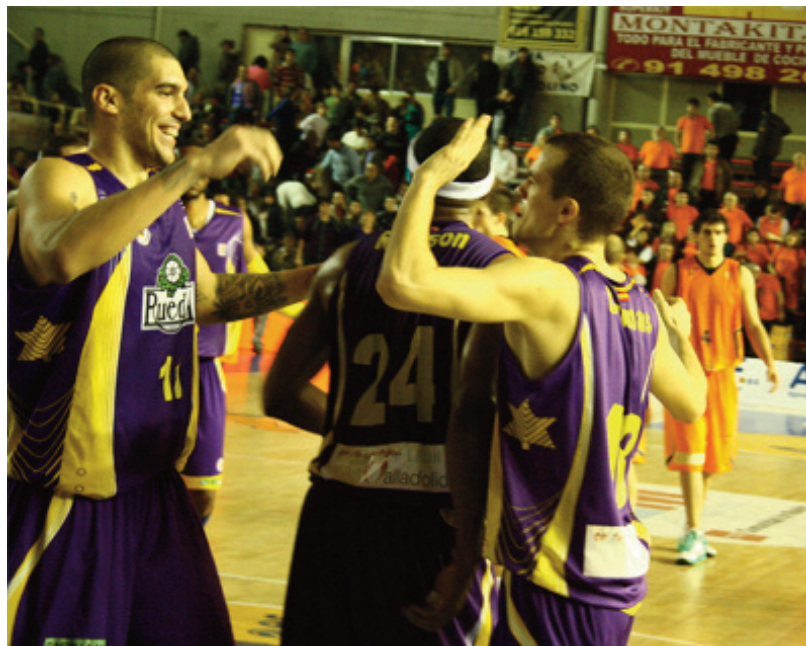
Valladolid celebra su clasificación para la Copa - Carlos Gómez

De hecho, los 6 equipos que han vencido a Valladolid esta temporada son victorias lógicas y esperables: Real Madrid y Barcelona, Menorca en Bintaufa, Lagun Aro en el Donosti Arena cuando el equipo de San Sebastián estaba en su mejor momento de competición, Unicaja en Málaga y CAI Zaragoza en Zaragoza.