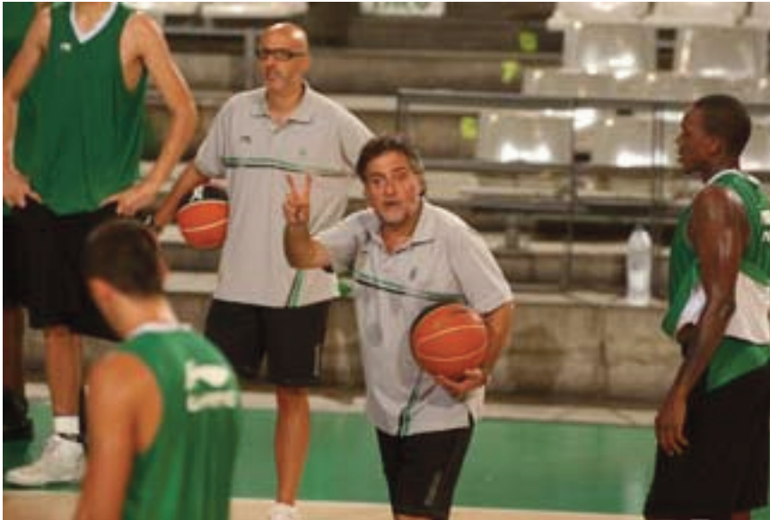
Pepu cumplió con su objetivo: están en la Copa

Hace nada nos emplazábamos en Bilbao para la siguiente edición, tomando el testigo Madrid, ciudad que ya ha albergado la Copa en varias ocasiones durante los últimos años.