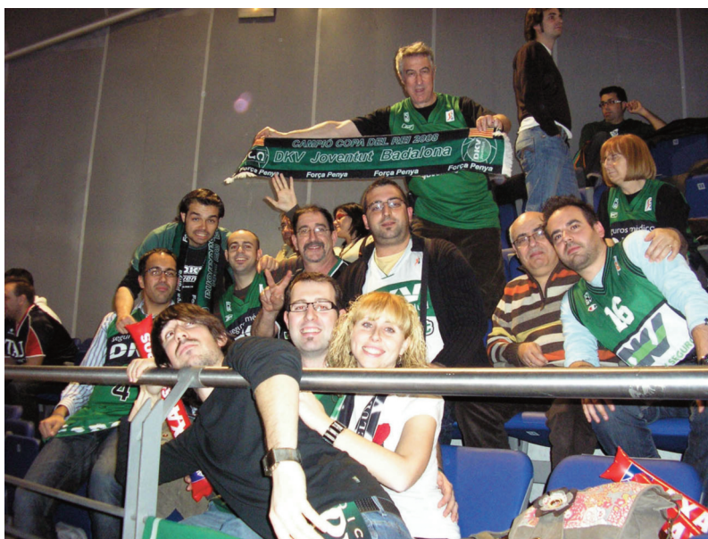
La afición disfrutará de la Copa - Borja Barrete

Ahora, tengo 4 días para descansar, y para afrontar lo que será el siguiente reto de Bkball.net ya que por medio de las diferentes vías de comunicación que tiene BkballGroup, os contaremos en vivo y en directo todo lo que atañe a la competición.