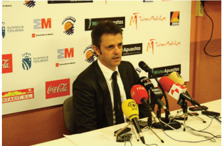
Porfi Fisac llevó a los suyos a la copa - Carlos Gómez

- Bizkaia Bilbao Basket: Los bilbaínos han ido toda la primera fase de tapados, este año ya no eran el equipo revelación, pero granito a granito y contando victorias se plantan en la Copa del Rey.