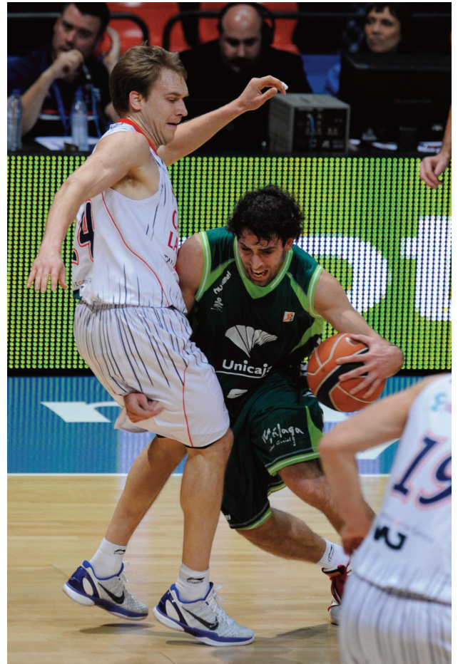
Baskonia volverá a Madrid