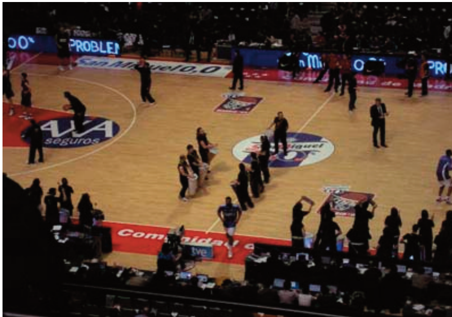
La Copa vuelve a Madrid en 2011.

La Copa del Rey tiene que ser diferente a todo. Tiene que tener un sorteo puro , al margen de mercantilismos baratos