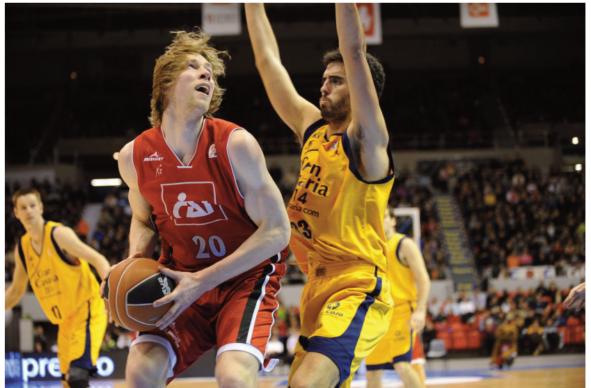
Foto del partido ante el CAI Zaragoza