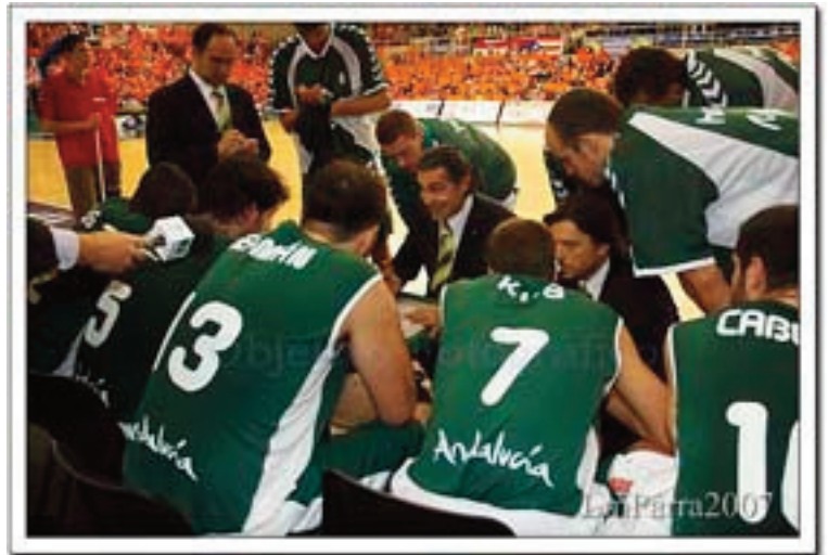
Unicaja en 2007.

Pero en 1951 algo cambiaba en el Baloncesto Español. Real Madrid y Joventut se repartían todos los títulos hasta el 56, que es cuando se crea la Competición doméstica (la Liga Española). El Real Madrid comenzaba a verse como un equipo potente, competidor y