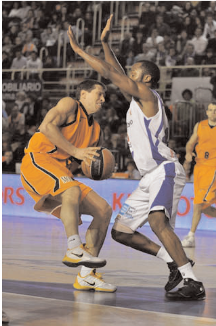
Fuenlabrada finalmente no acudirá