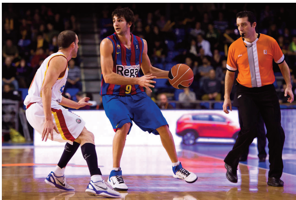
¿Recobrará Ricky su potencial en la Copa?

En un hipotético duelo de semifinales contra Caja Laboral , es de esperar un partido duro, porque Caja Laboral siempre quiere ganar la Copa del Rey y les pondrá en serios aprietos.