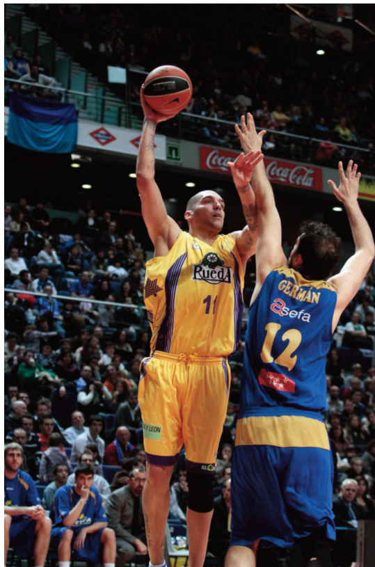
Sólo Asefa Estu pudo cortar la Racha

Intentar predecir qué hará Valladolid en la Copa del Rey es quizá más complicado que hacer que un caballo ande con sus patas traseras únicamente . Es una misión difícil sobre todo por el cuadro en el que ha quedado encuadrado. El partido ante el Power Electrónicos Valencia pinta como el más abierto de toda la Copa del Rey , y de pasar esta eliminatoria, el equipo vallisoletano ha demostrado ya que puede vencer a cualquier equipo, por lo que Real Madrid o Gran Canaria no deberían confiarse .